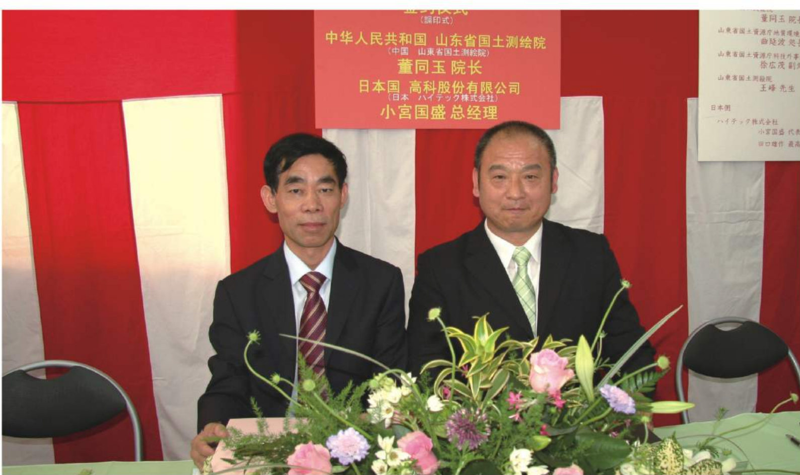
和日本客商签署合作协议