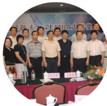
中南财经政法大学EMBA大讲堂暨EMBA北京校友会